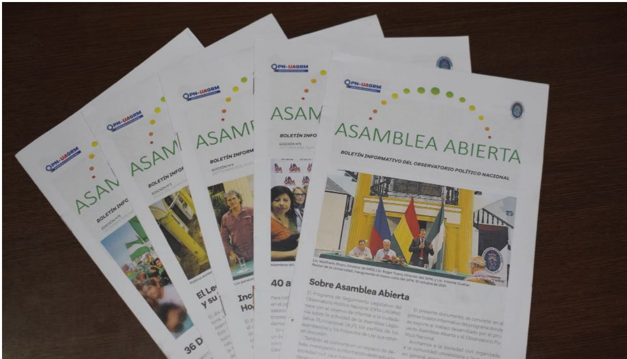
Ediciones de la gestión 2022 de Asamblea Abierta

A continuación, ofrecemos un detalle de las actividades realizadas por el Observatorio Político Nacional, y otras instituciones dedicadas al análisis y estudio de la realidad sociopolítica del país.