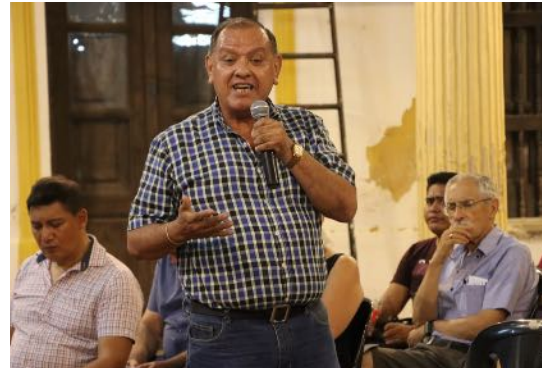
Público presente en el foro sobre los Desafíos del Poder Legislativo.

Finalmente se dio paso a los comentarios por parte del público asistente, quienes enriquecieron el debate propuesto.