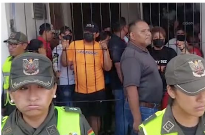
Policías custodiando el edificio de la Brigada Parlamentaria Cruceña