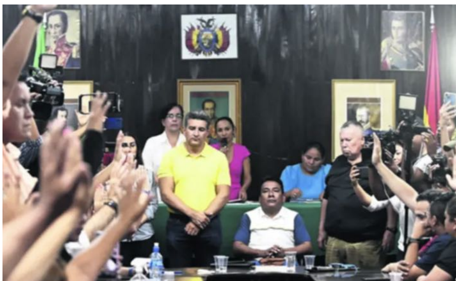
Posesión de la nueva directiva de la Brigada Parlamentaria Cruceña